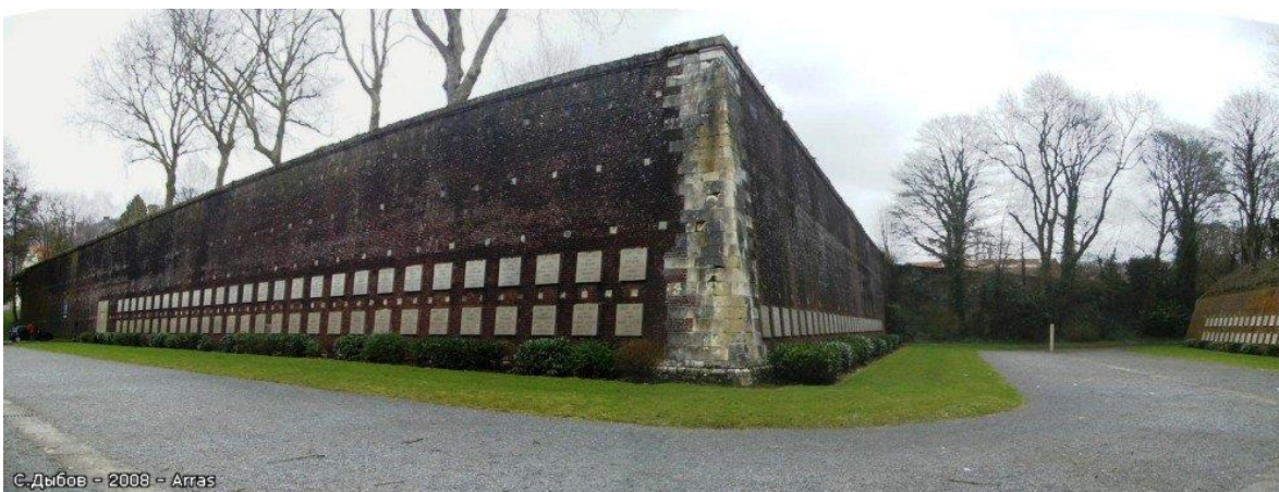
Стена Цитадели Арраса с мемориальными табличками