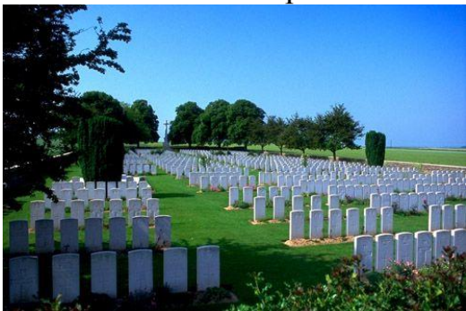
Общий вид кладбища