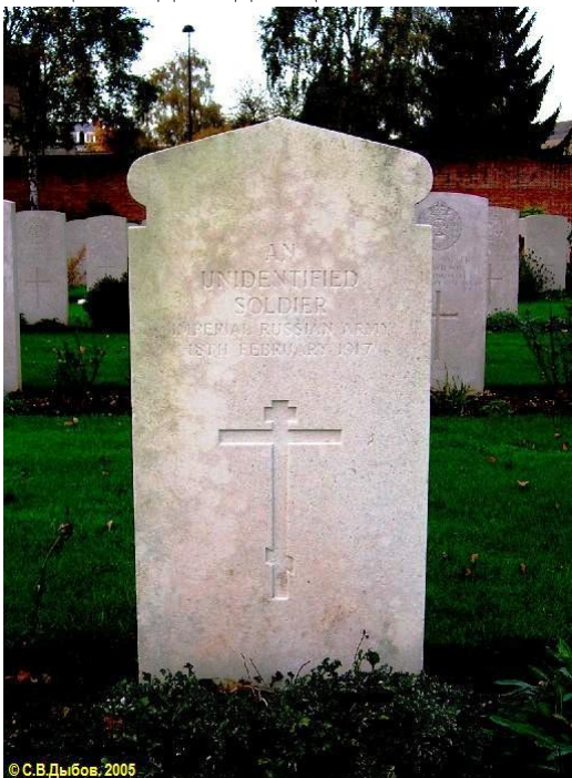
Могила неизвестного российского солдата