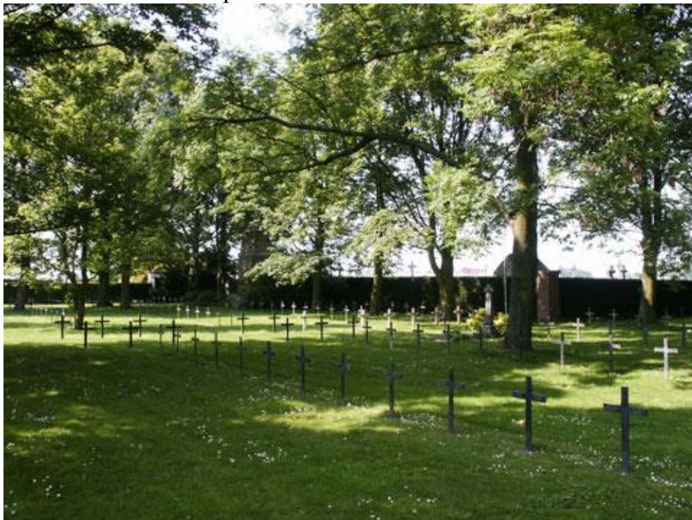
Общий вид кладбища