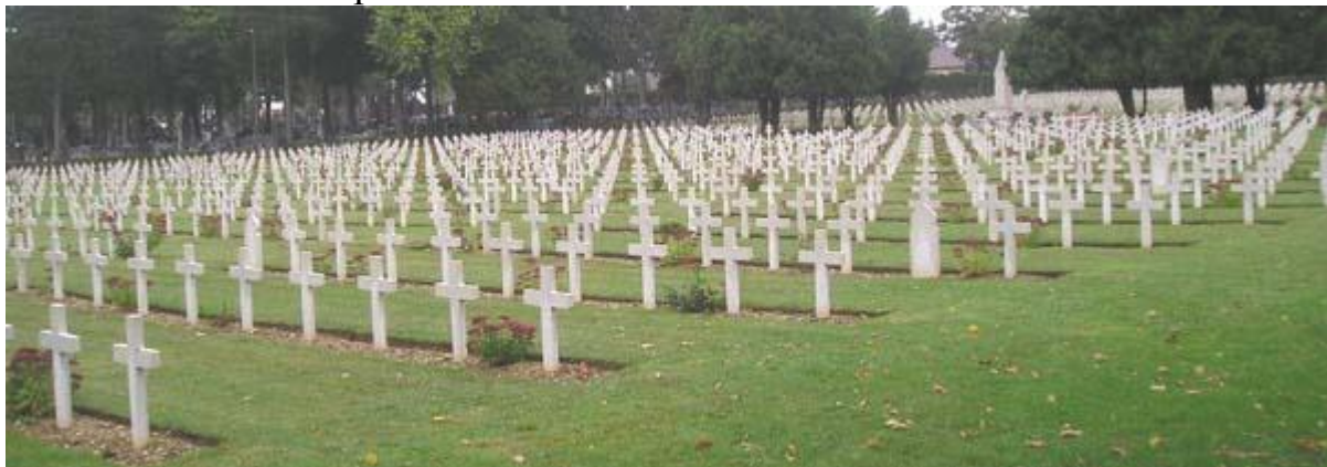
Общий вид кладбища